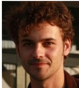
Tim van Puffelen Beheer leeromgeving