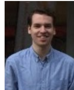
Jeroen van den Boom Wiskunde D Online Plus